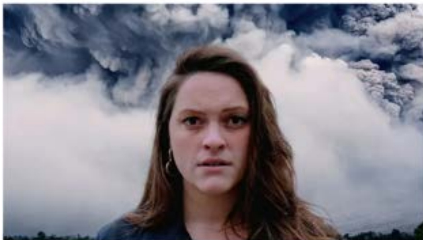
"La bombe humaine", un des spectacles très attendus au Théâtre des Doms.